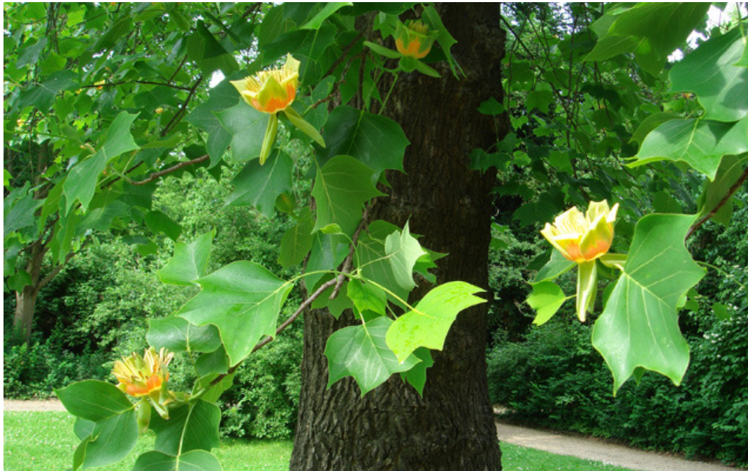
Amerikanischer Tulpenbaum im Marlygarten